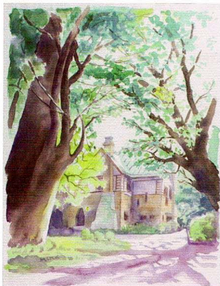
第2回スケッチコンテスト山本有三記念館賞 「木洩れ日の下で」玉記 巳奈子